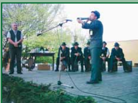
Vítěz troubení 2006