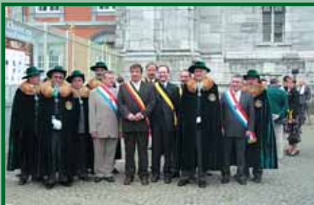
Delegace našich myslivců společně se starostou a radními městečka St.Hubert

Jeho význam pro křesťanství v hornatých a lesnatých Ardenách, kde se většina obyvatel živila lovem, byl nedocenitelný. Ještě za jeho života se mu dostalo pojmenování „Apoštol Arden“. Zemřel 30.května 727 a 3.listopadu 744 byly jeho ostatky přeneseny do městečka Andagia v Ardenách, které se od té doby jmenuje Saint Hubert.