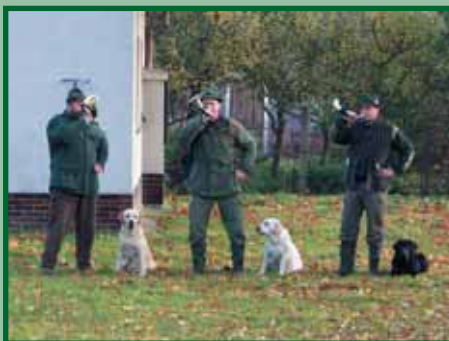
Karlovy Vary uspořádala Podzimní zkoušky ohařů a malých plemen . PZ, zkoušky lovecké upo-

Dne 22. září 2007 kynologická komise OMS