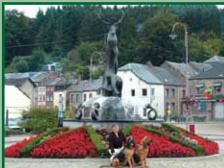
Jediný kruhový objezd v Saint Hubert zdobí svatohubertský jelen

Po přijetí starostou a členy městské rady z městečka St. Hubert navštívili místo posledního odpočinku svatého Huberta a společně z balkonu městské radnice shlédli několikahodinový průvod městem, který je součástí každoročních oslav.