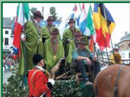
Alegorický vůz mezinárodního řádu svatého Huberta symbolizoval sepětí myslivců EU

Skupina myslivců OMS Karlovy Vary, kteří jsou členy Řádu svatého Huberta se v letošním roce vydala do belgického Saint Hubert na Svatohubertské slavnosti.