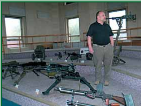
vojenského velitelství Karlovy Vary.

K tradicím nejen mysliveckým mimo jiné patří znalost naší minulosti. Z uvedeného důvodu jsme ve spolupráci s Armádou České republiky, zastoupené Vojenským zařízením 4953 Jaroměř a Krajského vojenského velitelství Karlovy Vary, uspořádali výstavu vojenských historických zbraní. Výstava se uskutečnila dne 22. dubna v prostorách Krajského vojenského velitelství Karlovy Vary. K vidění zde bylo několik desítek různých historických zbraní a výcvikové laserové střelnice. Za přípravu a vlastní organizaci výstavy upřímně děkujeme veliteli Vojenského zařízení 4953 Jaroměř a řediteli Krajského