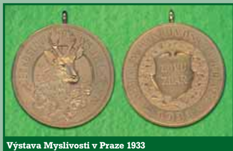
Výstava Myslivosti v Praze 1933