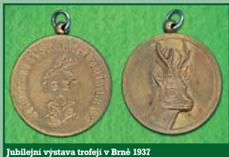
Jubilejní výstava trofejí v Brně 1937