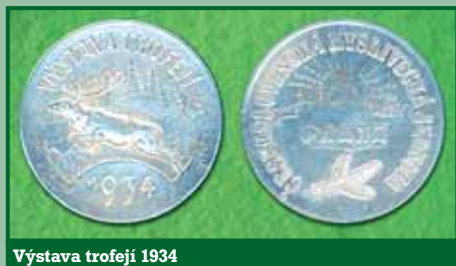
Výstava trofejí 1934