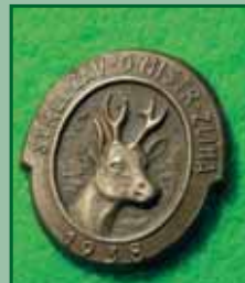
1938 – Střelecké záv. o mistra Zlína

Ani náš Okresní myslivecký spolek Karlovy Vary nezůstával pozadu a střelecká komise zorganizovala střelecké závody s velice hodnotnými cenami. Text na odznacích napoví.