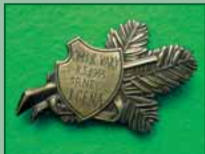
1955 – Srmec 1. cena 1955 O.M.S. K.Vary

Ani náš Okresní myslivecký spolek Karlovy Vary nezůstával pozadu a střelecká komise zorganizovala střelecké závody s velice hodnotnými cenami. Text na odznacích napoví.