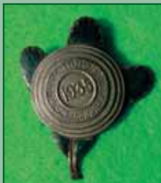
1935 – Mezinárodní střelecké závody PARDUBICE