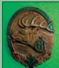
Okresní Myslivecký spolek K. Vary