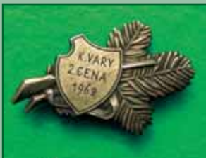
1962 – K.Vary 2. cena 1962