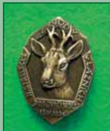
1934 – II střelecké závody v lázních „PODZVÍČINOU“

Palné zbraně fascinovaly lidstvo od samého počátku existence. Soutěživost si o střelecké závody řekla sama, a tak probíhaly na celém našem území. Tuto skutečnost dokládají námi předložené odznaky: