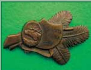
1957 – Tetřevík 1.cena 1957