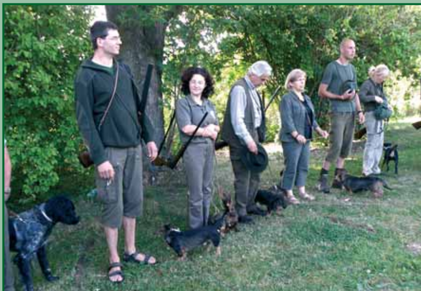
LZ 2009 Karlovy vary - Žlutice: Jezevčici na zahájení zkoušek