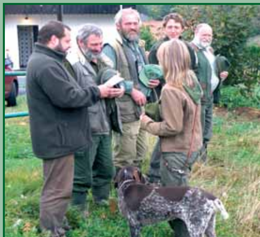
SZVP Vítězky zkoušek přijímají gratulace rozhodčích