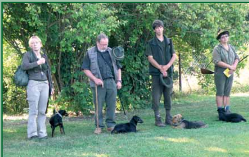
LZ 2009 Karlovy Vary - Žlutice: Teriéři na ranním nástupu

maximální možné množství 24 psů, z nichž se nakonec na zahájení ve žlutickém autokempu dostavilo 22 psů se svými vůdci. Po celodenním úsilí a v prvním letním horku nakonec všichni zkoušky úspěšně