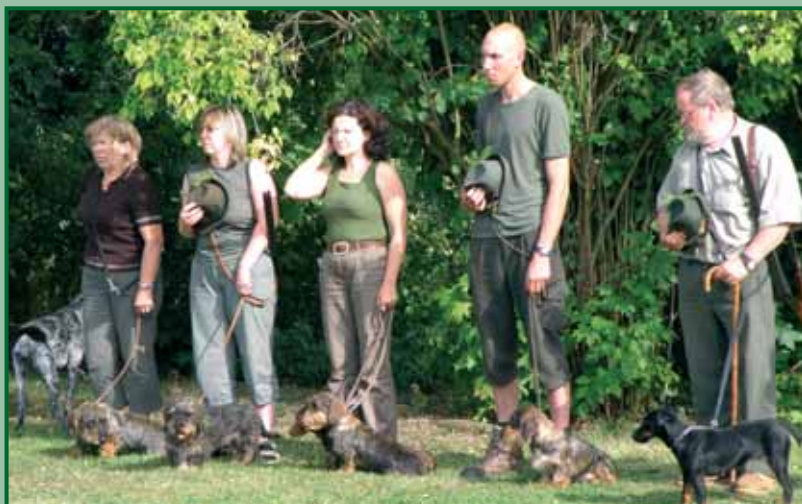
BZ 2009 Žlutice: Závěr zkoušek

Na BZ nastoupilo 12 loveckých psů, zástupců malých plemen a 1 ohař. Počasí bylo vyhovující, vlhký, slunečný den. Psi pracovali ve třech skupinách, které posuzovalo sedm rozhodčích. Protest nebyl podán žádný, chování a vystupování vůdců bylo sportovní.