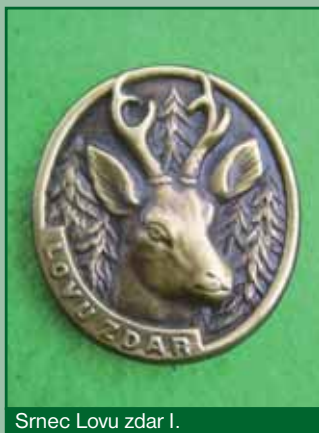
Srnc lovu zdar I.