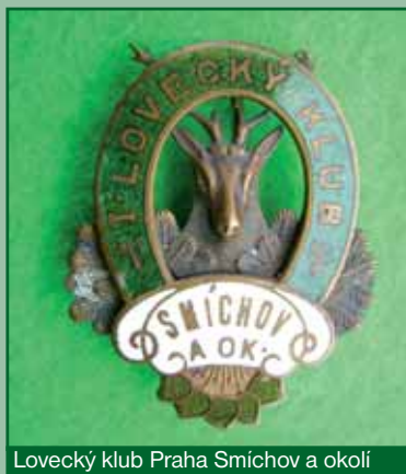
Lovecký klub Praha Smíchov a okolí