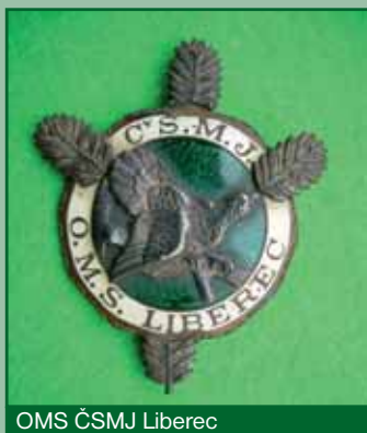
OMS ČSMJ Liberec