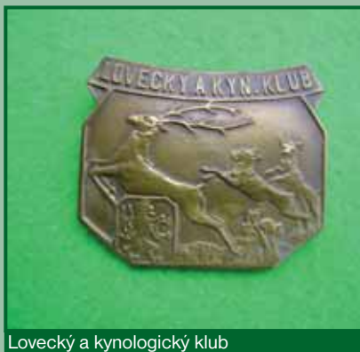
Lovecký a kynologický klub