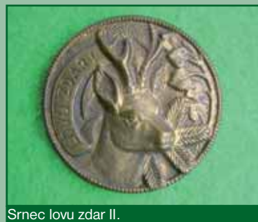
Srnc lovu zdar II.