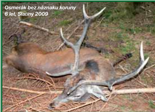
Osmerák bez náznaku koruny 6 let, Slatiny 2009