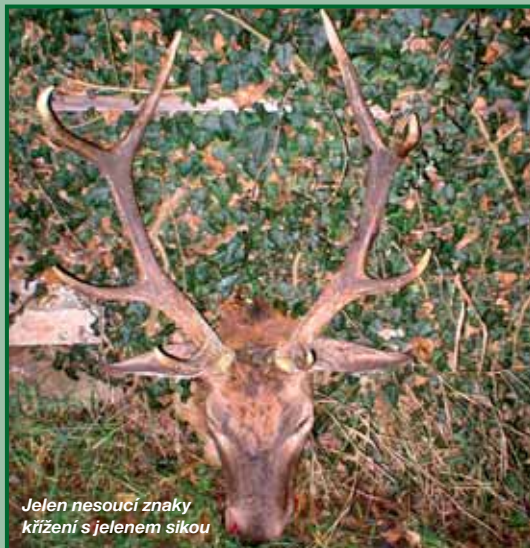
Jelen nesoucí znaky křížení s jelenem sikou