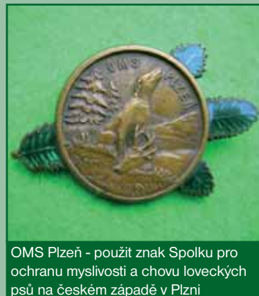
OMS Pízeň - použit znak Spolku pro ochranu myslivosti a chovu loveckých psů na českém západě v Plzni