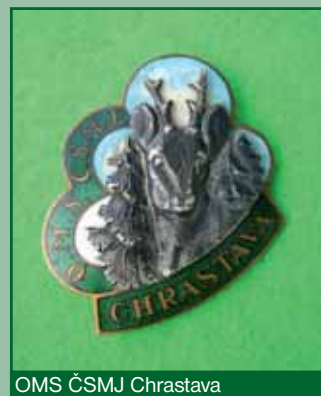
OMS ČSMJ Chrastava