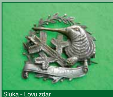
Sluka - Lovu zdar