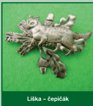
Liška – čepičák