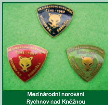
Mezinárodní norování Rychnov nad Kněžnou