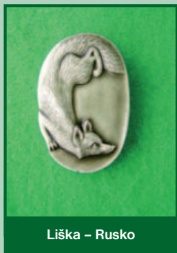
Liška – Rusko