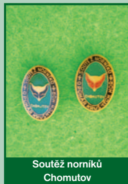
Soutěž norníků Chomutov