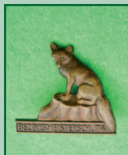
Liška – Německo