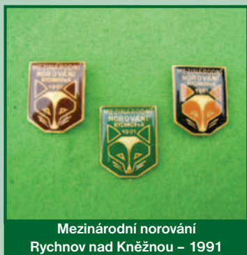
Mezinárodní norování Rychnov nad Kněžnou – 1991