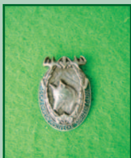
ČSMJ - OMS Česká lípa