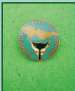
Mezinárodní norování Praha – 1965