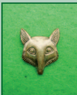
Liška – Klopový odznak