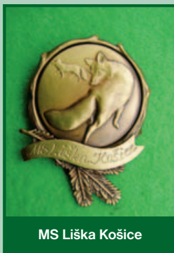
MS Liška Košice