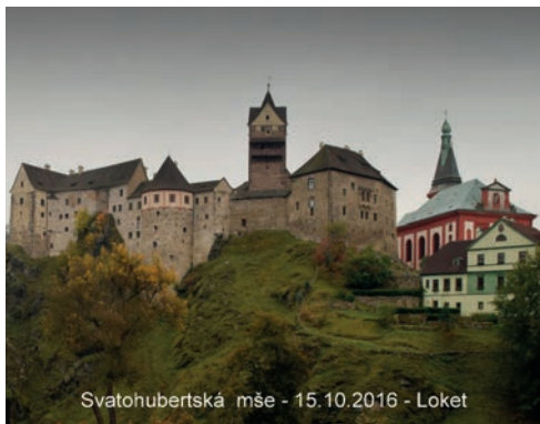
Svatohubertská mše - 15.10.2016 - Loket