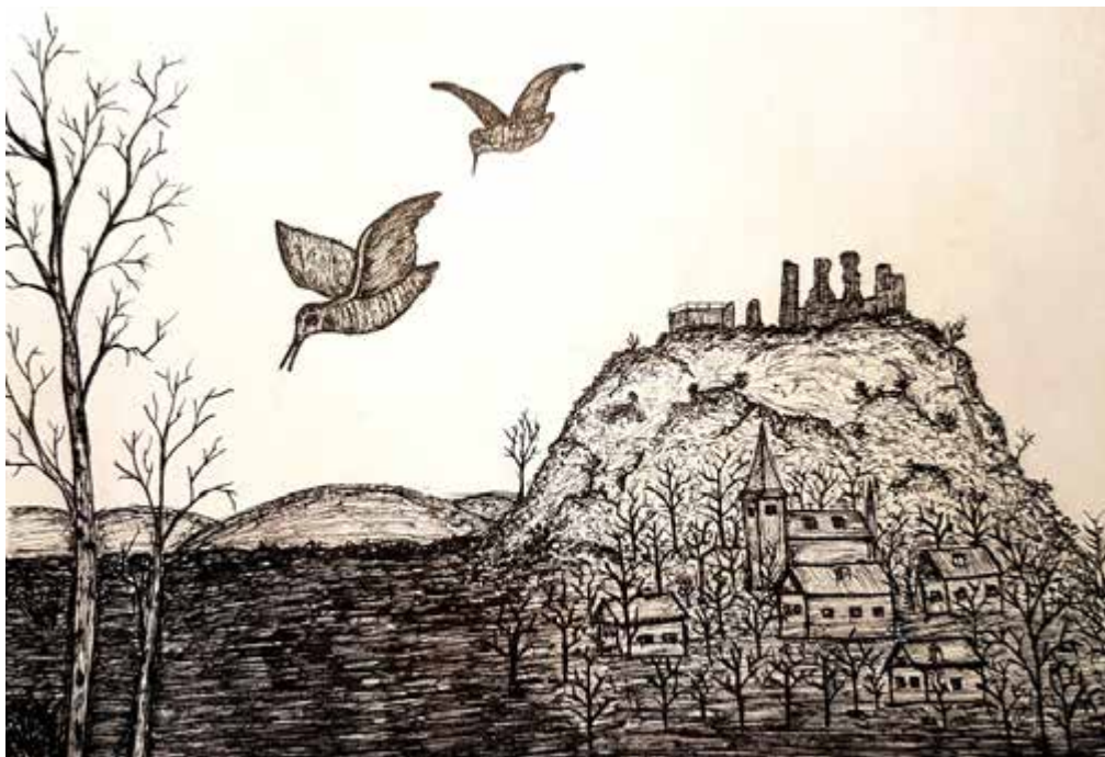
Jarní tah sluky lesní na slučí louce pod hradem